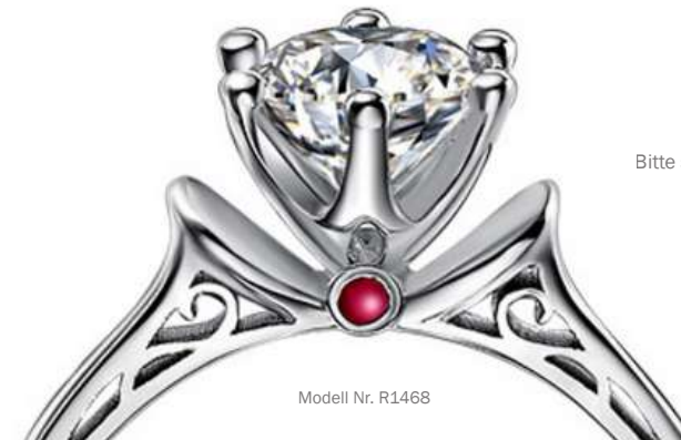
Modell Nr. R1468

Sie erhalten ein Foto des fertigen Schmuckstücks und es wird nach vollständiger Bezahlung geliefert.