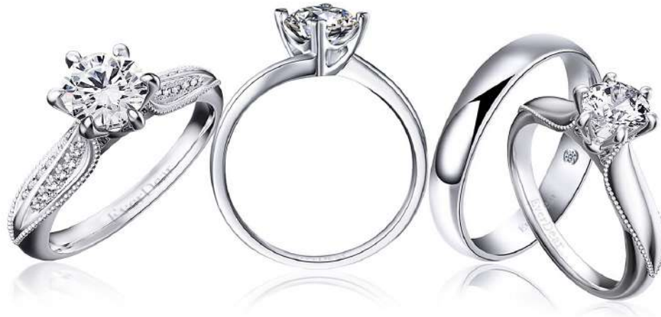
Modell Nr. R2110

Es gibt immer den klassischen Solitär-Diamanten mit 4 Zacken, und wenn es darum geht, zu glänzen und zu beeindrucken, wird eine Halo- oder Pavé-Fassung höchstwahrscheinlich Ihre Wünsche erfüllen. Wenn es um das Gedenken geht, ist jeder Einäscherungs-Diamantring einzigartig. Unser Ansatz mit einem einzelnen Diamanten rückt die Erinnerung an Ihren geliebten Menschen in den Mittelpunkt und macht sie zu einem besonderen Erlebnis. Der raffinierte und exquisite Kremations-Diamantring wird ewig halten und die Erinnerung an Ihren Verstorbenen unendlich lange bewahren.