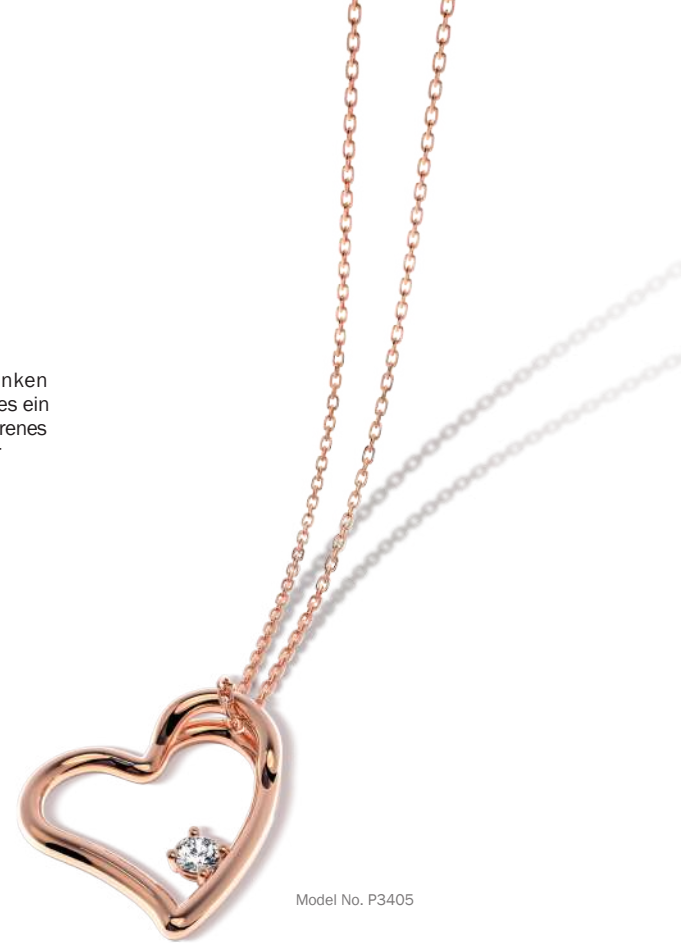
Model No. P3405

Einäscherungsdiamanten sind eine einzigartige Möglichkeit, das Andenken an einen Geliebten zu bewahren, sei es ein verstorbener Angehöriger, ein neugeborenes Kind, ein geliebtes Haustier oder der liebste Partner.