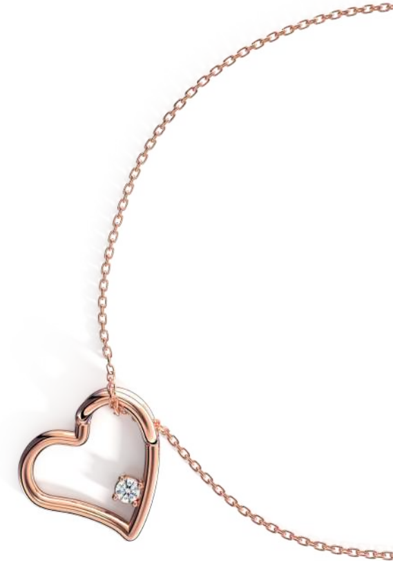
Modell Nr. R2109