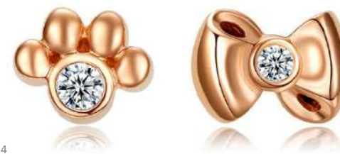
Modell Nr. E0544

EverDear™ verkauft nicht über Agenten oder Distributoren, so dass Sie keine Provisionen zahlen müssen.