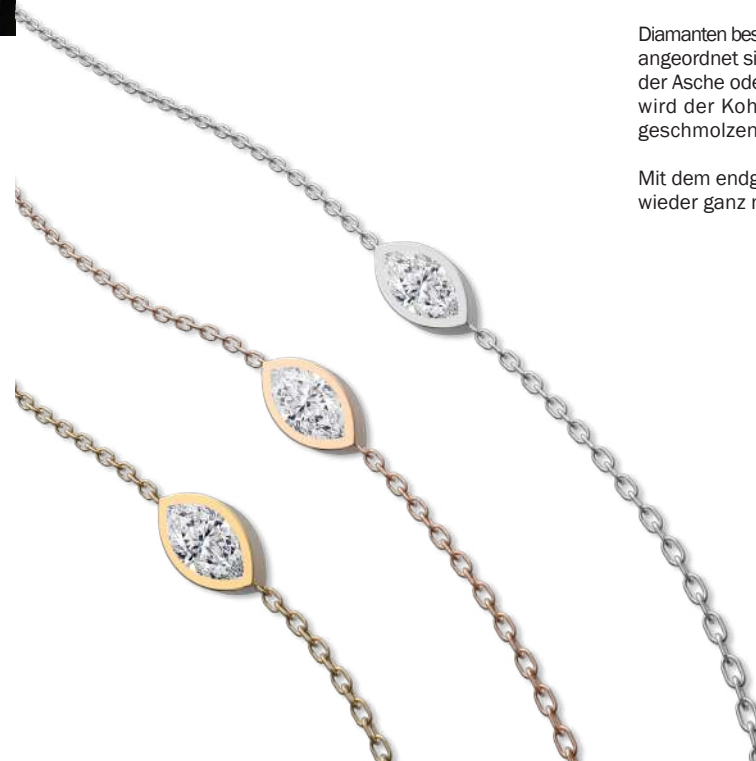
Modell Nr. B2847

Mit dem endgültigen Gedenkdiamanten können Sie Ihren geliebten Angehörigen wieder ganz nah bei sich haben.