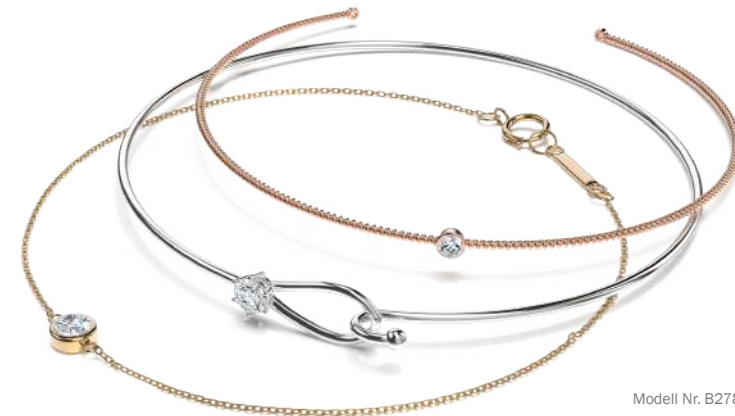
Modell Nr. B2847

Sie werden sich in die Eleganz unserer diamantenen Kremationsarmbänder verlieben. Wir betonen die Einzigartigkeit Ihres Einäscherungsdiamanten, indem wir mit unseren Armbandfassungen einen eigenen Schwerpunkt setzen. Ihr individueller Diamant wird mit einer Brillanz und einem Feuer funkeln, wie es kein anderer Diamant auf der Welt hat. EverDear™ Kremations-Diamantarmbänder heben den Diamanten in seiner reinsten Form hervor.