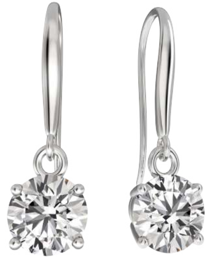
Modell Nr. E0099

Nichts kommt an die Schönheit unserer eleganten Kremations-Diamant-Ohrringe heran. Während zahlreiche Fassungen auf dem Markt mit einer Vielzahl von Edelsteinen überladen sind, sind die EverDear™ Kremations-Diamant-Ohrringe schlicht gehalten und konzentrieren sich auf die sentimental, emotionalen Zuneigungen des Schmucks. Unsere klassischen Ohrringfassungen werden von einem einzigen Diamanten geschmückt, der für immer funkelt.